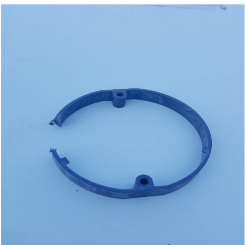
- Distanční kroužek