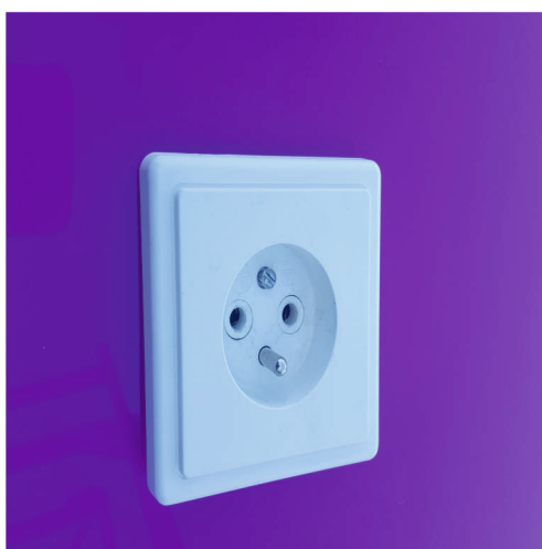
Hotovo - Krásná Práce