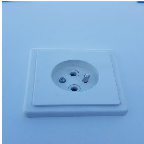
- Zásuvka ukotvená ve zdi